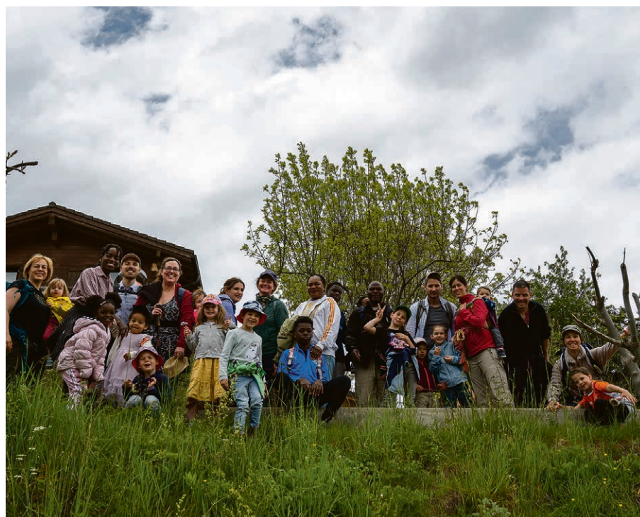
Le week-end familleS en Valais.

Un rendez-vous accompagné de deux morceaux d'orgue avec, au centre, la lecture d'un texte biblique, d'une brève méditation puis d'un temps important de silence. Dans l'église d'Épalinges, de 18h15 à 19h, les mardi 9 juillet, 13 août et 10 septembre.