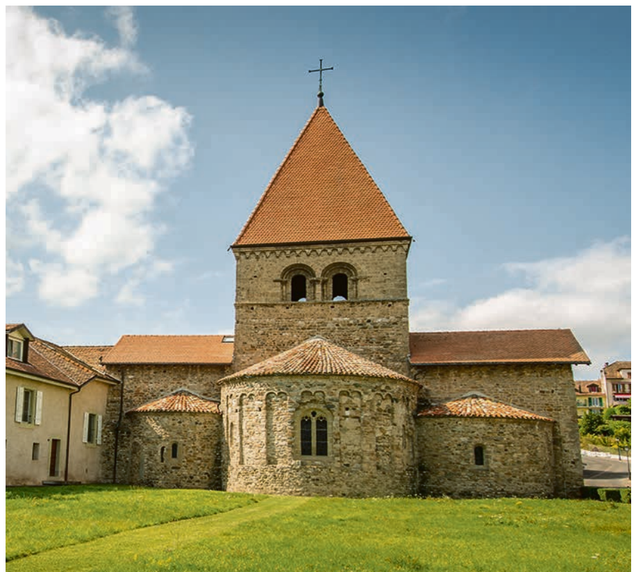
L'église de Saint-Sulpice, en rappel de la belle sortie effectuée.

Philippe sera absent du 15 au 21 juillet et du 5 au 18 août.