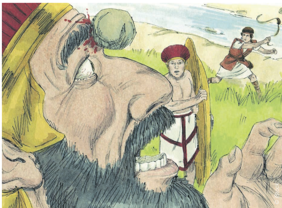
David sort vainqueur contre Goliath.

Quoi qu'il en soit, si dans le sport le corps est aujourd'hui soumis à l'ascèse et à la performance, l'influence ne provient pas de la Bible. Ces notions sont déjà liées à la pratique sportive dans la Grèce antique, où des rites religieux étaient d'ailleurs célébrés lors des jeux. Et aujourd'hui, l'ascèse et le dépassement de soi sont également associés à l'islam, au bouddhisme et à l'hindouisme, notamment à travers la pratique du yoga ou la redécouverte du jeûne. ▲ Nathalie Ogi