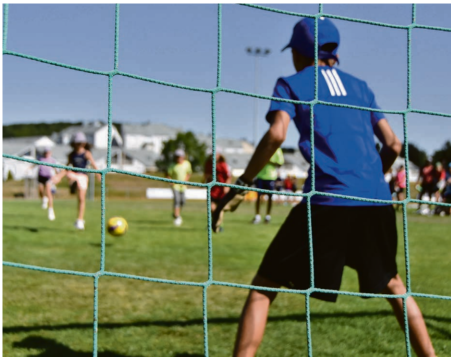
S'engager pour les KidsGames, c'est permettre à de nombreux enfants de s'éclater !

LA REGION Les KidsGames, ce sont six jours de folie, du 4 au 9 août, à Epalinges. Il y a encore quelques places pour les enfants de 7 à 14 ans qui vivront ce camp de jour au milieu de l'été. Chaque matin, un temps pour vivre une animation biblique et l'après-midi : place au sport ! Entre les enfants et les jeunes qui coachent les équipes, ce sont plus de 200 frimousses qui sont attendues. C'est magnifique et cela demande aussi un encadrement important : préparer les repas, garder les enfants le matin puis le soir après les activités sportives, prier, arbitrer les matchs, soutenir les enfants qui ont des besoins particuliers durant le jour... Et ces tâches – importantes ! – ne peuvent être assumées que par des adultes. Vous vous sentez pousser des ailes de bénévole ? Alors, n'hésitez plus : naviguez sur la page des KidsGames et inscrivez-vous comme bénévole, votre engagement est génial ! www.t.ly/kidsgames-lausanne-benevoles ▶