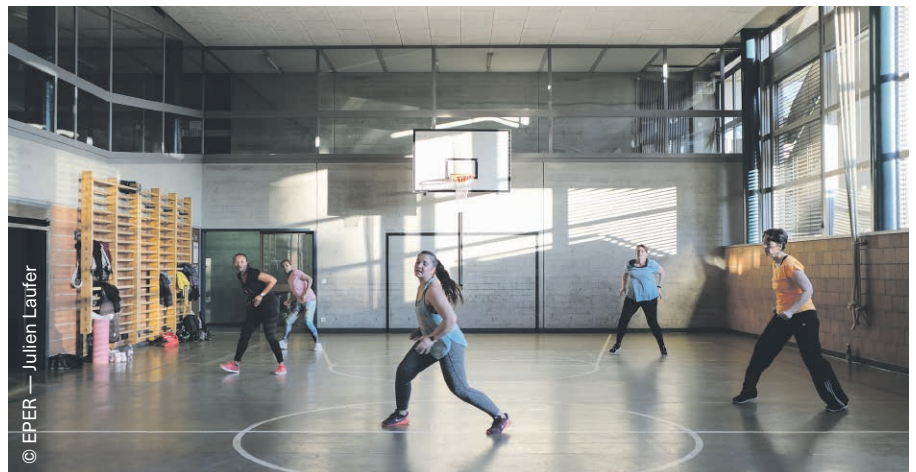
Si beaucoup de clubs sportifs suisses sont orientés vers la compétition, les besoins des migrants en matière sportive tournent d'abord autour de la santé et de la possibilité de tisser des liens.

Il y a d'abord un réel besoin de rencontres de la part des primo-arrivants qui « ont peu de contacts avec des personnes en Suisse depuis plus longtemps et vice versa. » Il y a ensuite l'envie de reprendre une