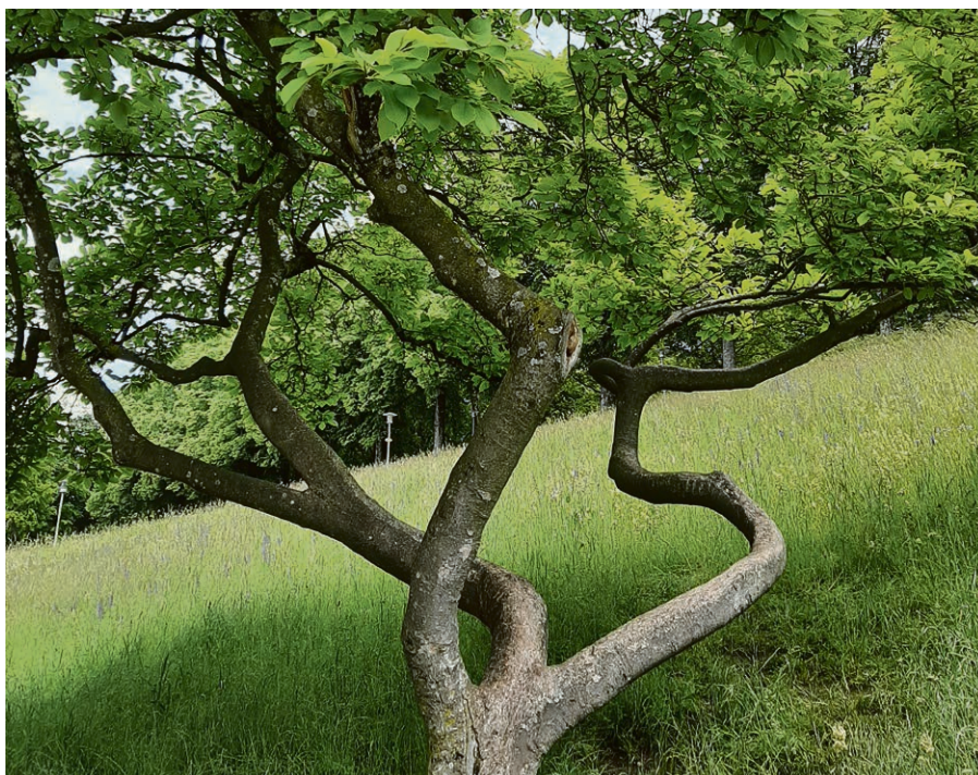
En promenade.

Baguage des mouettes rieuses et des sternes pierregarins à l'île aux oiseaux (Préverenges), le samedi 6 juillet 2024, à 9h , sur place. Suivi d'un pique-nique tiré des sacs à la Maison de l'île, fin vers 13h. Rendez-vous à 8h30 à la Maison paroissiale de Saint-Jean. Inscription obligatoire auprès de Jean-Daniel Courvoisier