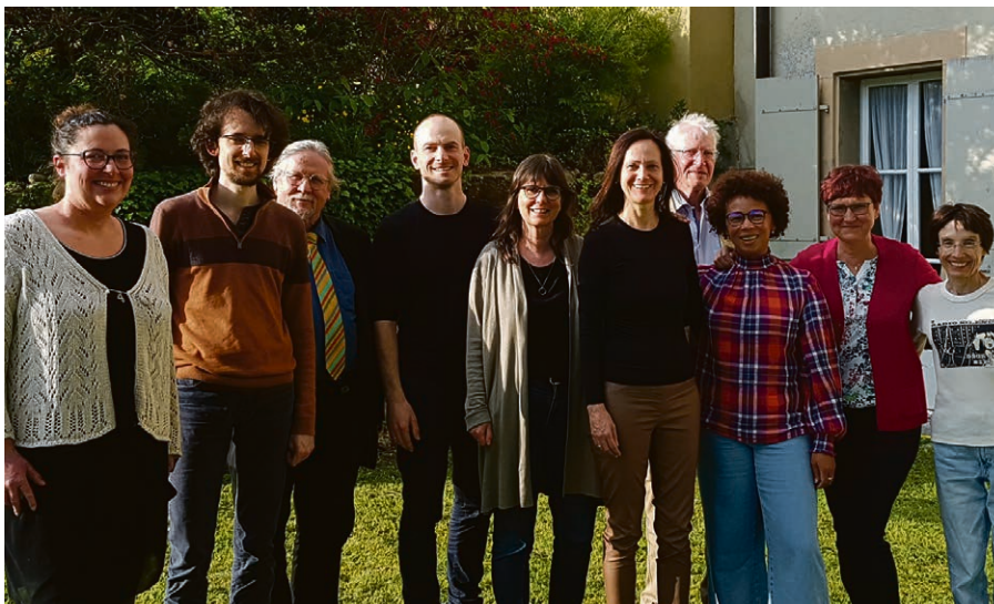
Le nouveau conseil de paroisse élu au printemps.

La nouvelle équipe s'est répartie les différentes tâches.