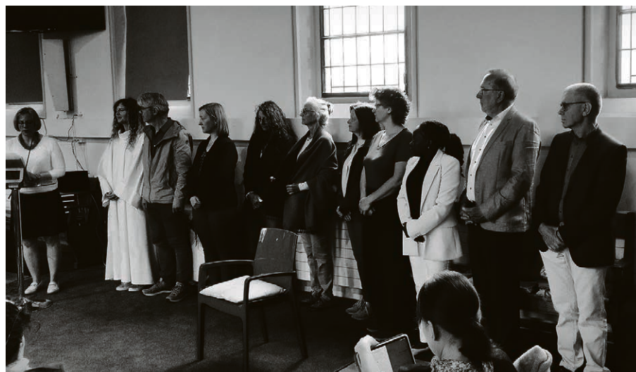
Le conseil de paroisse lors de son culte d'installation.