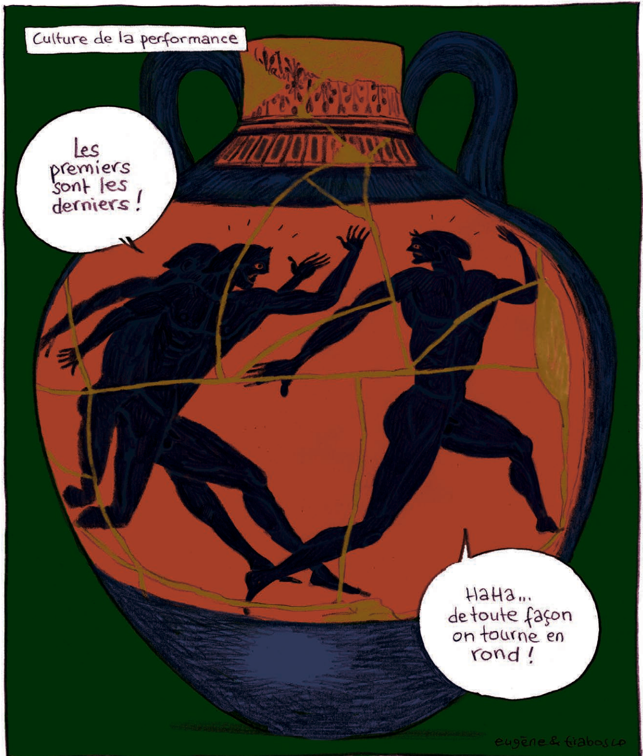
« Coureurs », amphore à figures noires, vers 500 av. J.-C.