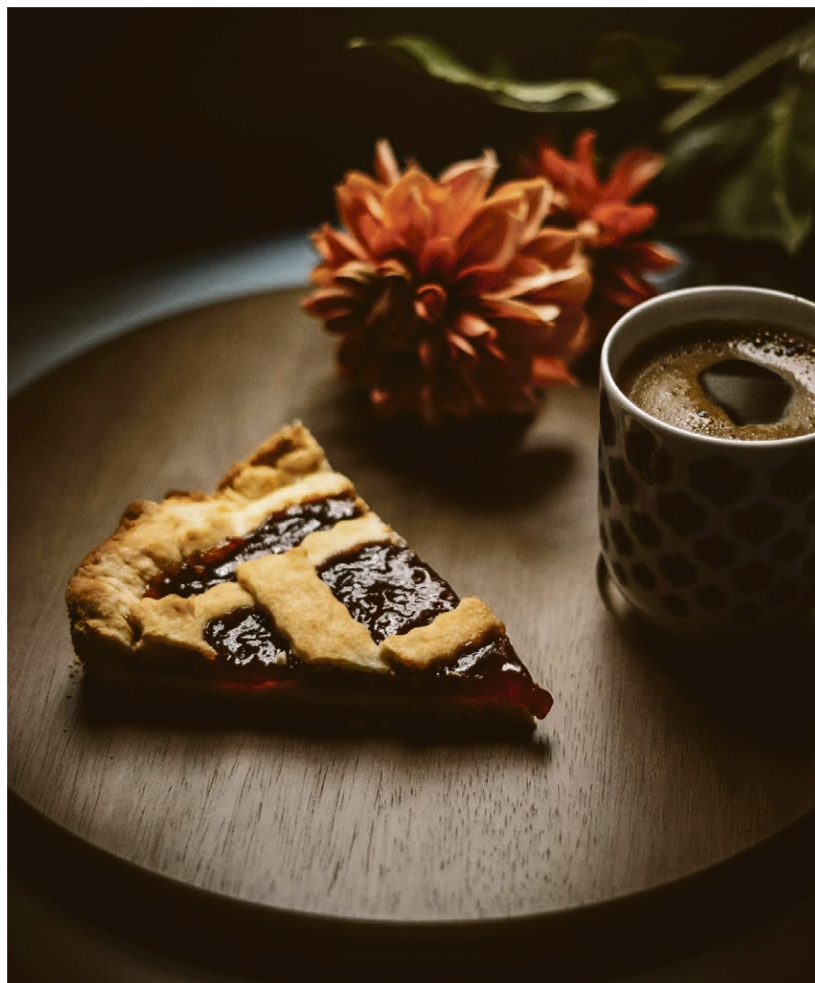
Kaffee und Kuchen in der Villamont.

... dass Sie Kirchgemeindemitglieder damit mit uns weiter machen und anwesend sind. ▲