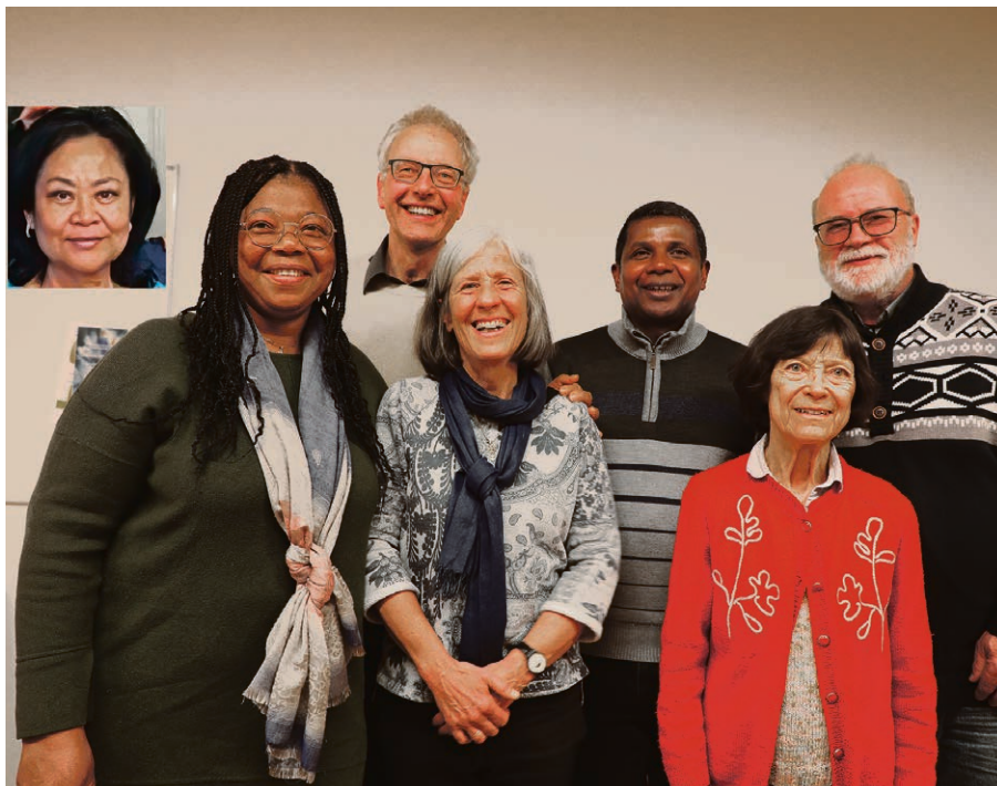
Le nouveau conseil paroissial sera installé le dimanche 30 juin.

Le 18 août et le 25 août, à 10h, avec le chœur Prim'psautier, à Saint-Jean à Cour. Les paroissien-nes du SOL sont vivement invité-es à se déplacer pour ces occasions uniques (plus d'infos : rubrique de la paroisse Saint-Jean).