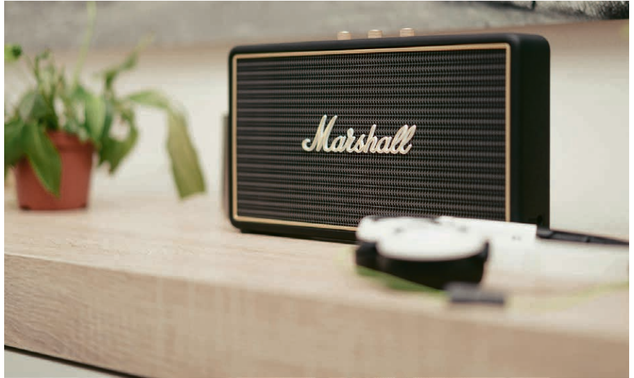
Le culte radio, à suivre d'un peu partout !

Cette année, l'offre sera multiple ; Godly Play pour les enfants, rencontres intergénérationnelles (on espère que des enfants et des adultes et/ou aîné-es partageront ces moments et s'enrichiront) autour du chant ou de la Bible le jeudi en