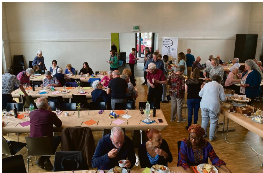
Le brunch à Faoug, un moment de bonheur.

VULLY - AVENCHES Avec la fin de l'été, le catéchisme et les activités enfance sont sur le point de reprendre. Pour donner le coup d'envoi, la paroisse organise un culte familles dimanche 22 septembre, à 10h , à Cotterd. Les catéchumènes y recevront leurs bibles. Les enfants auront un avant-goût du thème de l'année: «Que la musique soit!» Au programme, toute une série de mélodies: les mélodies de la Bible et les mélodies du cœur, des animations pour les petits et les grands. Saurons-nous trouver la note juste pour nous rapprocher de Dieu?