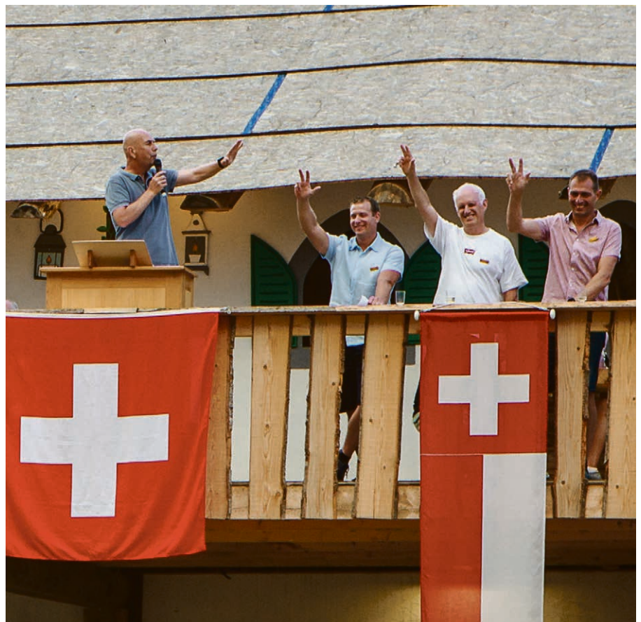
Faire prêter serments à trois syndics !

Votre don, même modeste, contribue à rendre la paroisse vivante ! IBAN CH83 0900 0000 1715 5789 6.