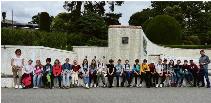
Après la cathédrale, les KT 7 et 8 en sortie à Lausanne se sont arrêtés au Musée olympique.