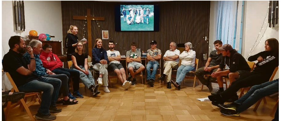
Abschlussfeier der Jugendgruppe 2023-2024.