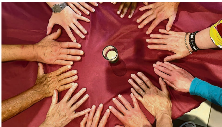
Groupe de parole autour du deuil : soutien et solidarité.