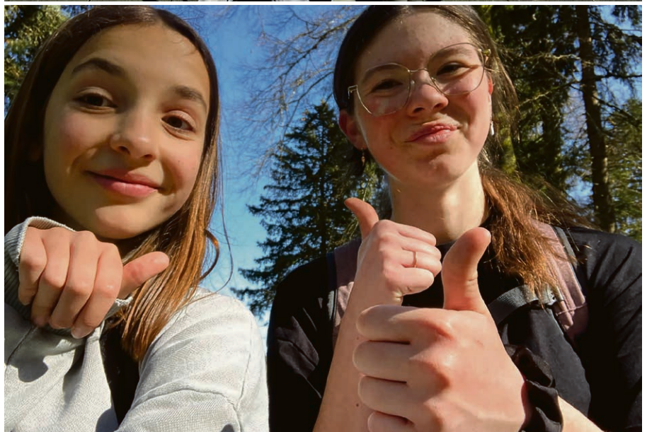
Des jeunes Jacks qui se sont engagés cette année.