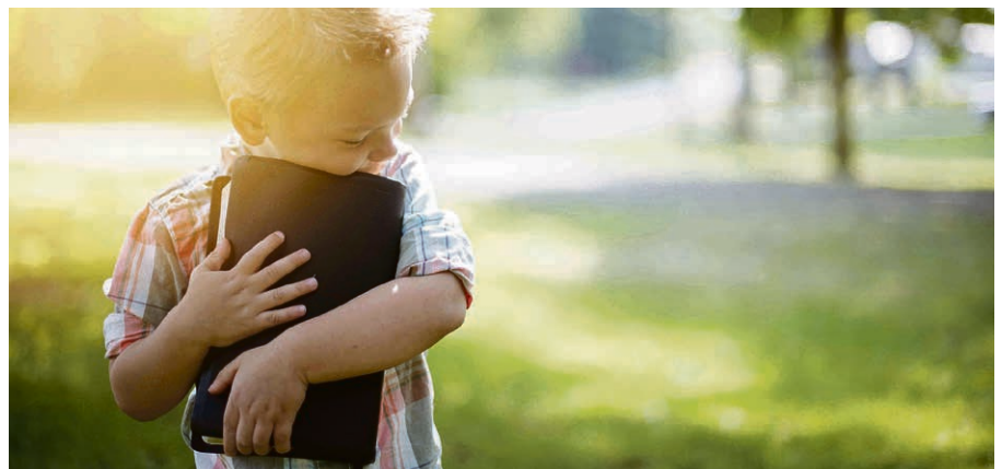
Eveil à la foi, Dieu leur parle.

CURTILLES – LUCENS Afin de pouvoir offrir l'Evangile à nos jeunes de façon adaptée à la disponibilité de chacun, les groupes de l'Eveil à la foi (3 à 6 ans) et du catéchisme (6 à 13 ans) se réuniront quatre fois pendant l'année, les samedis de 9h30 à 15h30 . Les repas de midi seront partagés entre tous. Pendant cette journée, les participants prépareront aussi le culte du lendemain où les familles seront conviées. Pour plus d'informations, prenez contact avec nos ministres, Joëlle Pasche et Geneviève Buttica.