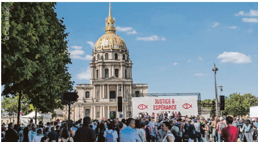
Rassemblement œcuménique du 23 juin.