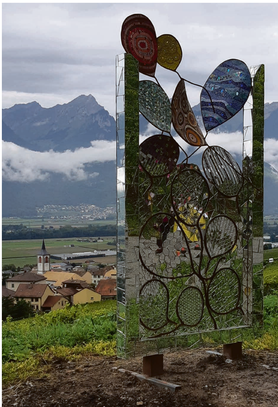
Lors de la marche méditative du 4 septembre.