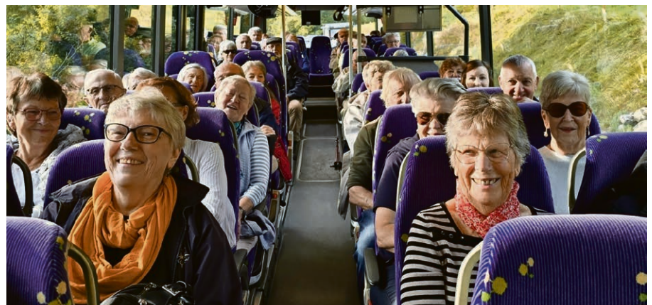
De la bonne humeur lors de la sortie des aînés!

Automne rime avec AMO! Un magnifique programme musical vous attend au temple d'Ollon. Renseignements: automne-musical.ch.