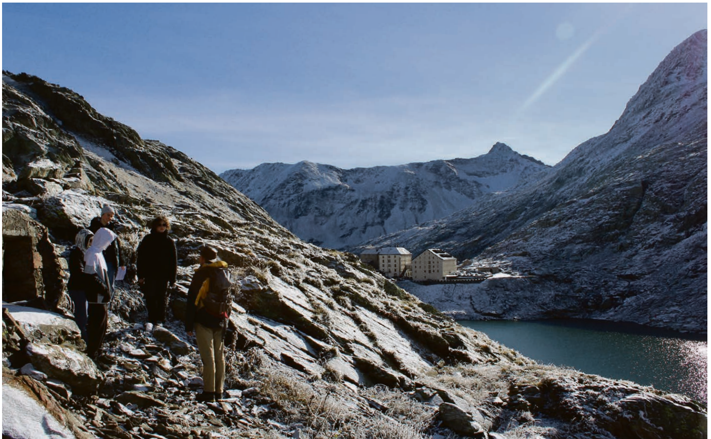
Le parcours 3D (découvrir, développer, discerner la foi chrétienne) a débuté par un week-end au Grand-Saint-Bernard les 27, 28 et 29 septembre.