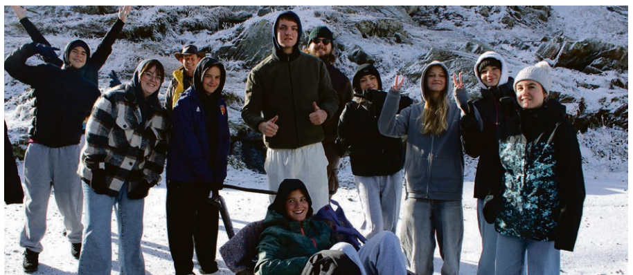
Ce week-end a aussi été l'occasion de découvrir ou de redécouvrir le paysage grandiose du Grand-St-Bernard.