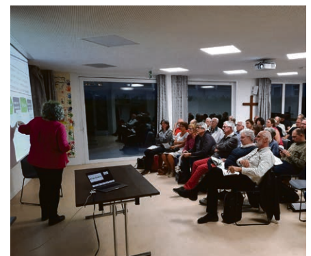
Une forte délégation de notre paroisse a participé à la rencontre régionale Eglise 29.

Vendredi 15 novembre, à 20h , à la salle paroissiale de Vers-l'Eglise, soirée bi-