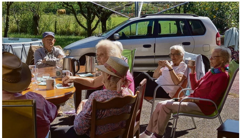
Gemütliches Beisammensein in Bex nach dem Bettagsgottesdienst in Aigle.

Gleich an drei Orten feierte unsere Kirchgemeinde den Bettag am Sonntag, 15. September 2024: In der Farel-Kirche in Aigle mit anschliessendem Brunch auf dem Bauernhof. In Clarens als open air Gottesdienst hinter der Klinik CIC und schliesslich zweisprachig in der Kirche La Tour-de-Peilz. Auf Französisch heisst der eidgenössische Dank-, Buss- und Bettag „Jeûne fédéral“ – „eidgenössisches Fasten“. Tatsächlich riefen unsere Vorfahren das Schweizer Volk in Notlagen zum Fasten auf. Auch die Bibel erzählt vom Fasten in Notzeiten. So fasten die Juden des persischen Reichs angesichts der gegen sie geplanten Pogrome; sie kla-