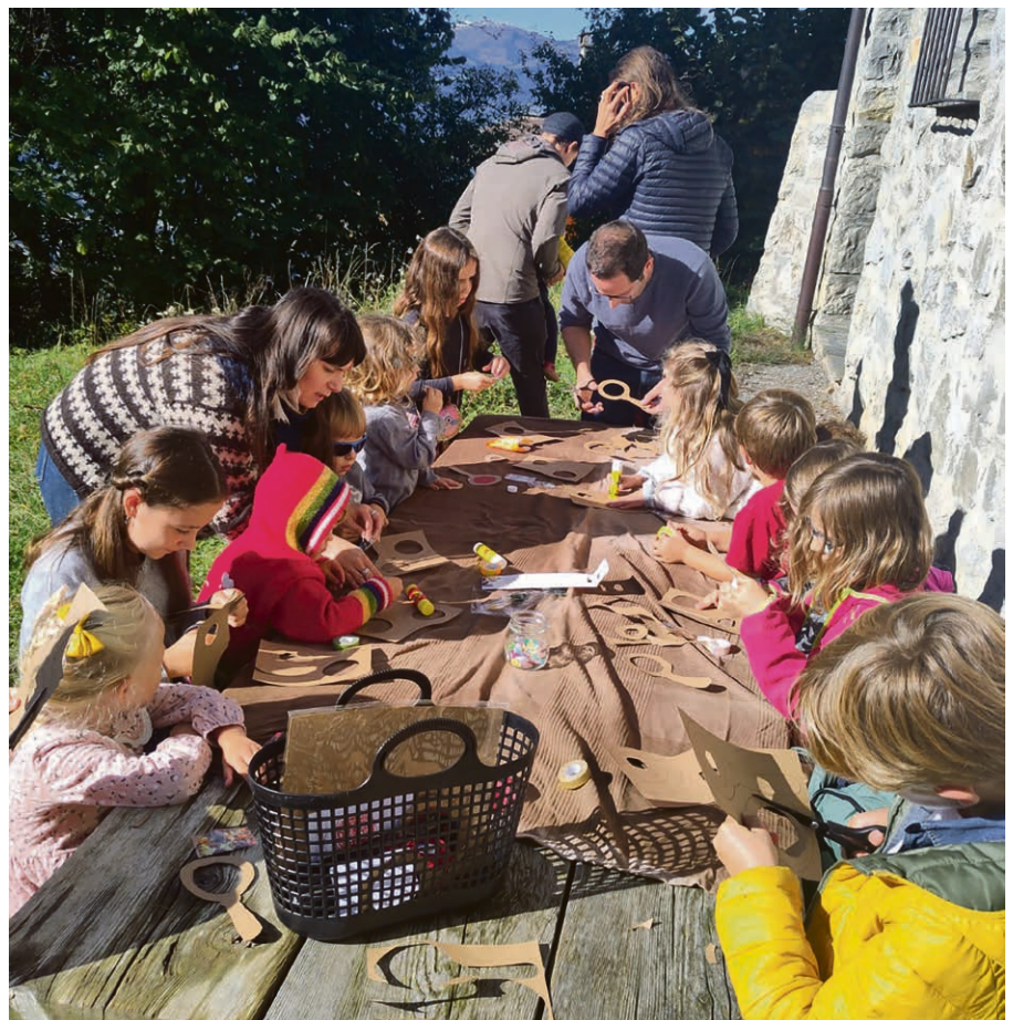
Bricolage avec les enfants pendant le culte au Posses-sur-Bex.

Ce parcours aura lieu les 2 e et 4 e mercredis du mois, de 19h à 21h30, à partir du 30 octobre en neuf séances. On commencera avec un repas léger canadien suivi d'un temps de lecture de la Bible