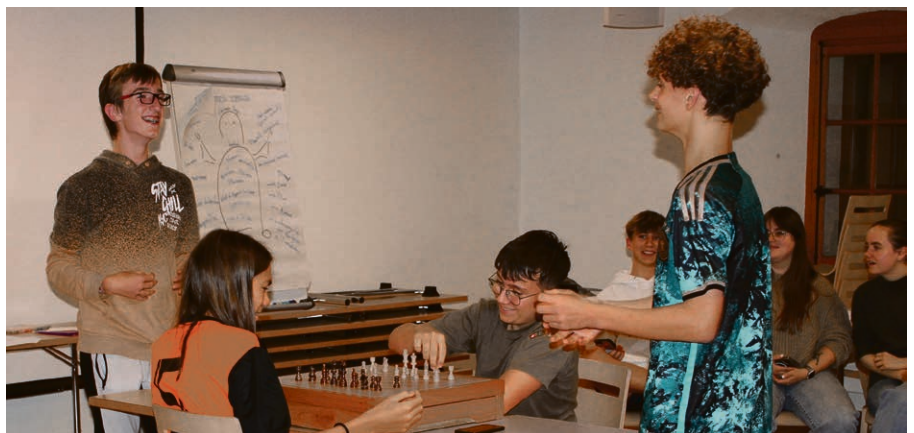
Jeux et activités ludiques ont ponctué le week-end.