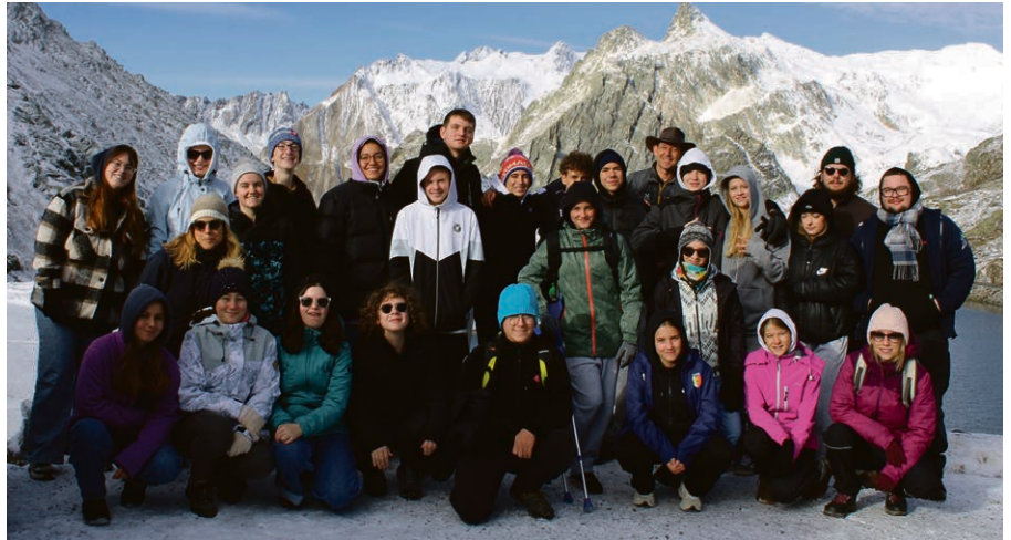
14 jeunes et trois Jacks se sont retrouvés au Grand-Saint-Bernard du 27 au 29 septembre pour découvrir la foi chrétienne.